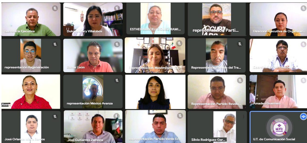
2ª Sesión Ordinaria de la Comisión de Organización Electoral de fecha 27 de septiembre del 2023