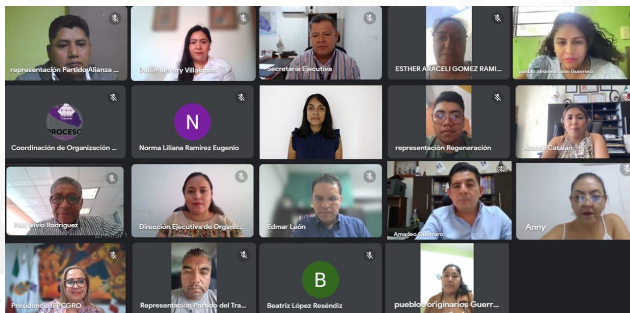
3ª Sesión Ordinaria de la Comisión de Organización Electoral de fecha 23 de octubre del 2023