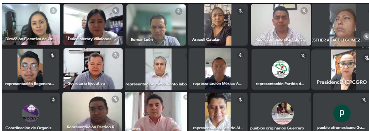
4ª Sesión Extraordinaria de la Comisión de Organización Electoral de fecha 09 de noviembre del 2023