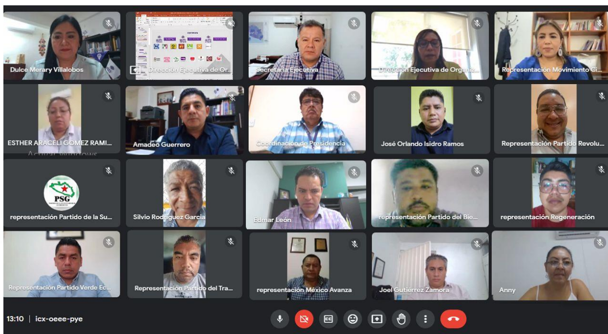
1ª Sesión Ordinaria de la Comisión de Organización Electoral de fecha 29 de agosto del 2023