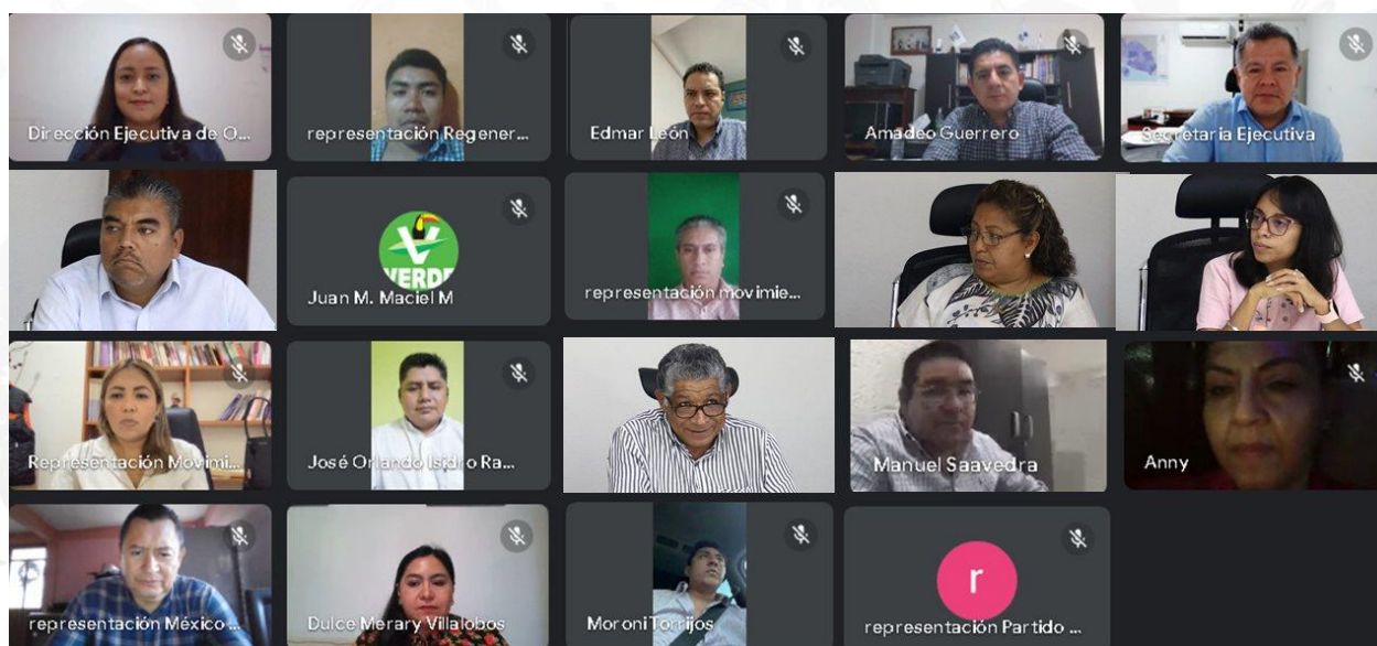
1ª Sesión Extraordinaria de la Comisión de Organización Electoral de fecha 05 de septiembre del 2023